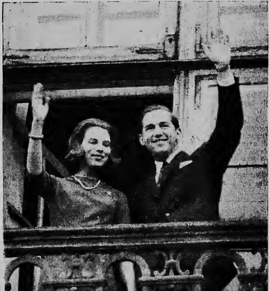
Princesa Anne Marie di Dinamarca y Prins Constantijn di Grecia ta saluda e poblacion entusiasma di Dinamarca for di e balcon di e palacio real Amalienborg na Copenhagen.

Tercer y ultimo wega ta senjala pa diadomingo mainta 10.30 y lo ta entre e dominicanan y Caribe.